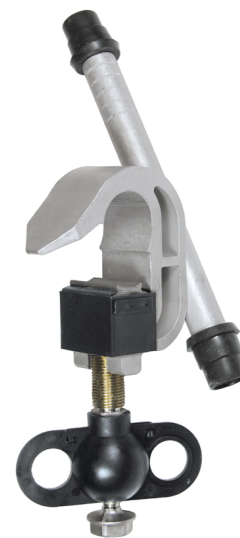
CBO 54 G