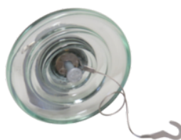
U40AP = U40 + TAPU40B