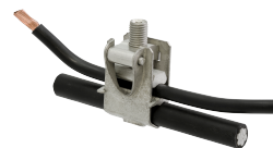
CM 60 S