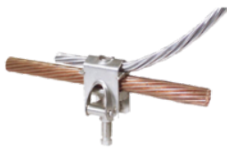
CM .. US