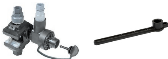
NTD 50-35 AFA