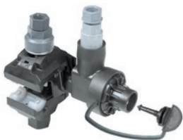
NTD 50-35 AFA