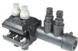
NTD 150-150 AFA/EFA