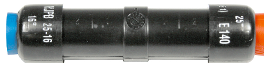
MJPB 25-16 CG

Mise en oeuvre : sertissage par rétreint hexagonal avec matrice E140.