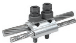
PGA 302 GCF