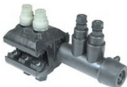
TTDR 88 F2A